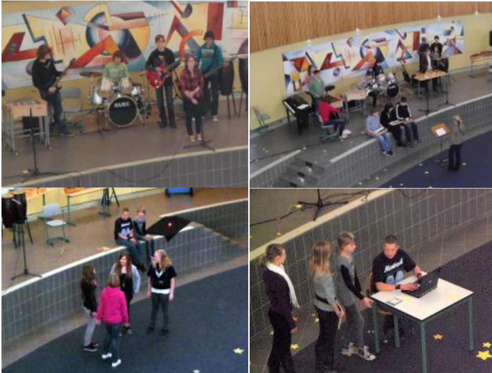
Schüler aus Klasse 7 stellen ihre Kenntnisse aus dem Französischunterricht vor.