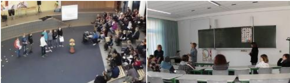
Auch Kenntnisse aus dem Russischunterricht waren Teil des Programms. Danach konnte jeder in den Fachräumen diese Sprachen mit Unterstützung der Siebenklässler selber ausprobieren. Auch alle anderen Unterrichtsfächer hielten in ihren Räumen viele Dinge zum Probieren und Staunen bereit.