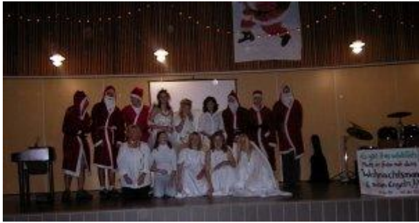
Foto mit Weihnachtsmann und wunderschönen Engeln gefällig? Klasse 13 machte es möglich!