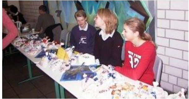
Plätzchen in allen Varianten konnte man am Stand der Klasse 8 a erwerben.