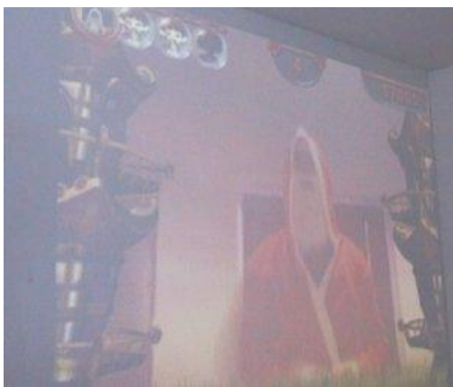
Sogar der Weihnachtsmann versuchte sich bei Eyetoys.