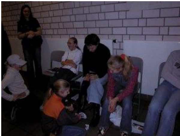
Bei der Klasse 7 c konnte man sich die Schuhe putzen lassen. Mit sauberen Schuhen in die Weihnachtsferien!!! Das war eine tolle Idee, die gerne auch von Lehrern genutzt wurde. Wann wird man sonst so von Schülern bedient!