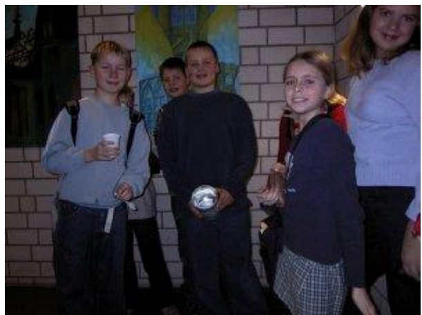
Lose gab es bei der 5 b. Und wer Glück hatte, konnte sich anschließend im Klassenraum seinen Gewinn abholen. Dafür hatten viele ihr geliebtes Plüschtier oder Lieblingsbuch geopfert.